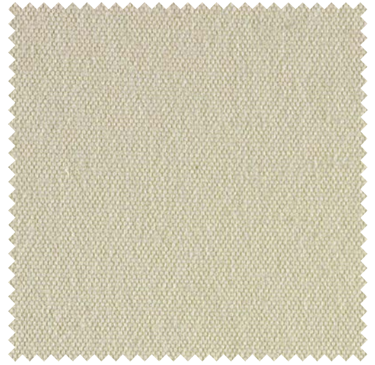
-00500 / -00501