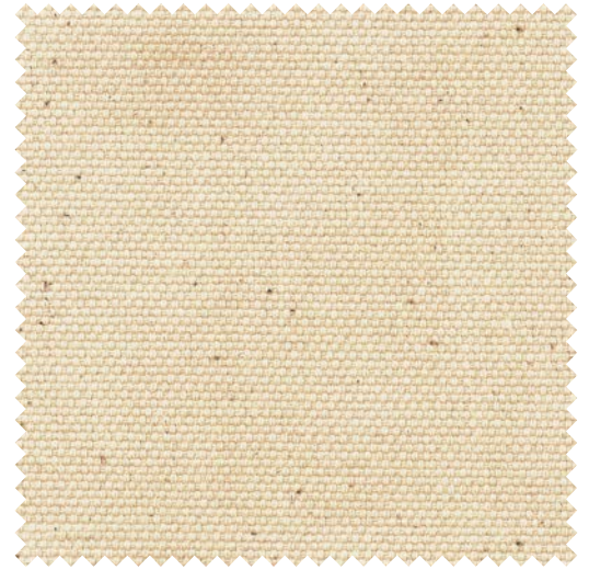
-03000 / -03001