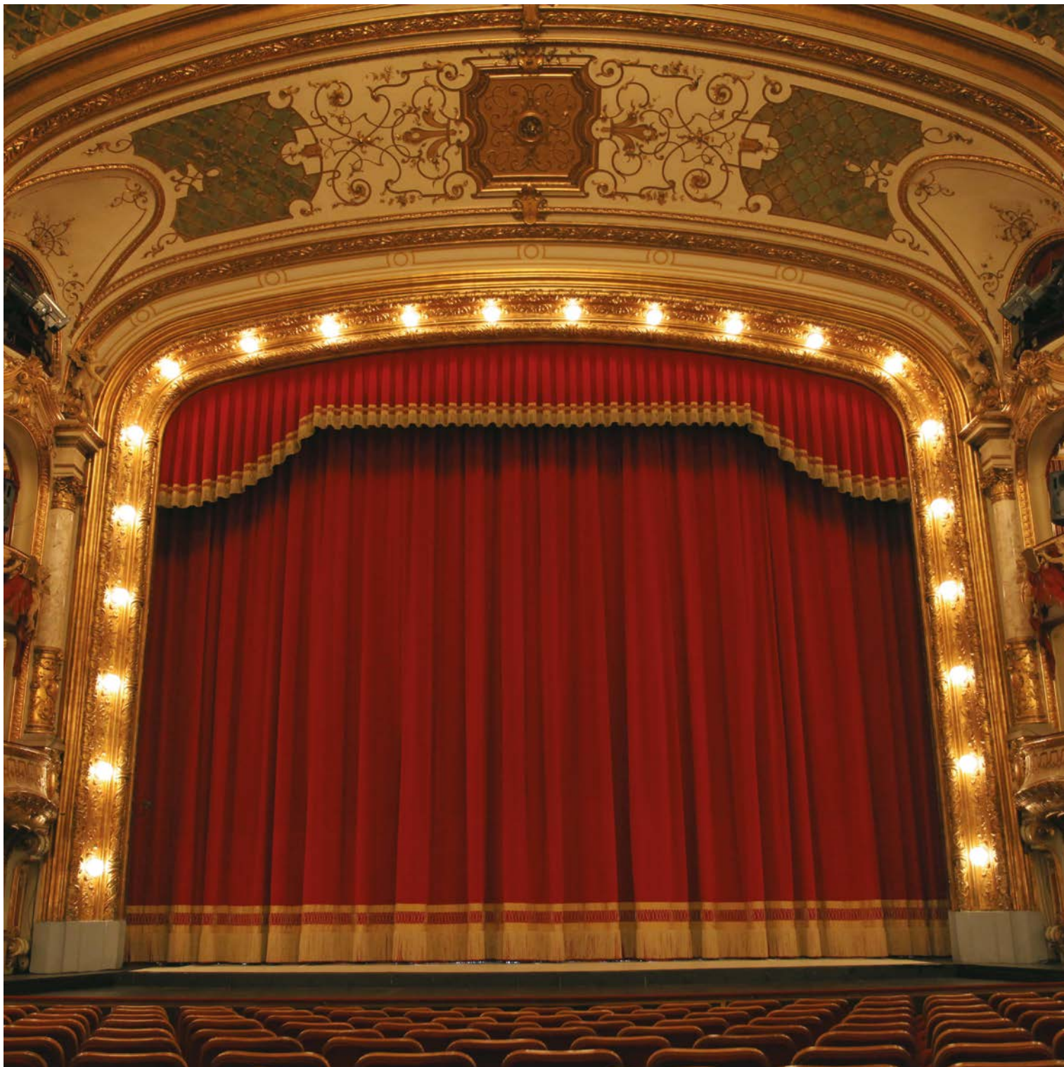
Croatian National Theatre, Zagreb – Croatia / Main Curtain: made in two pieces from ALICANTE stage velour, color wine red, with ECLIPSE lining and hand-crafted 75 cm high fringe. Size each part: 6.50 m wide x 10.84 m high (+50 % fullness).