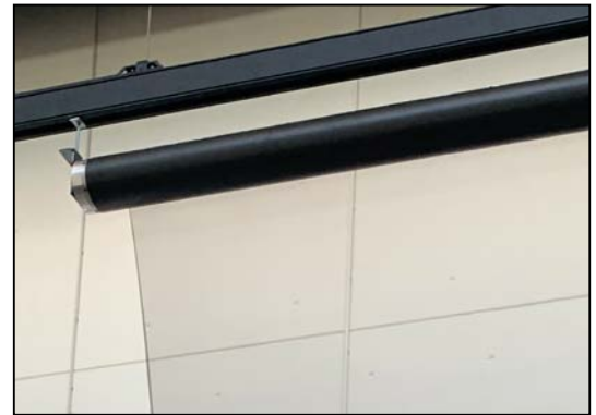
Einsatz auf dem Gerriets TUBE System / Utilisation sur le système TUBE de Gerriets / Installation on the Gerriets TUBE system