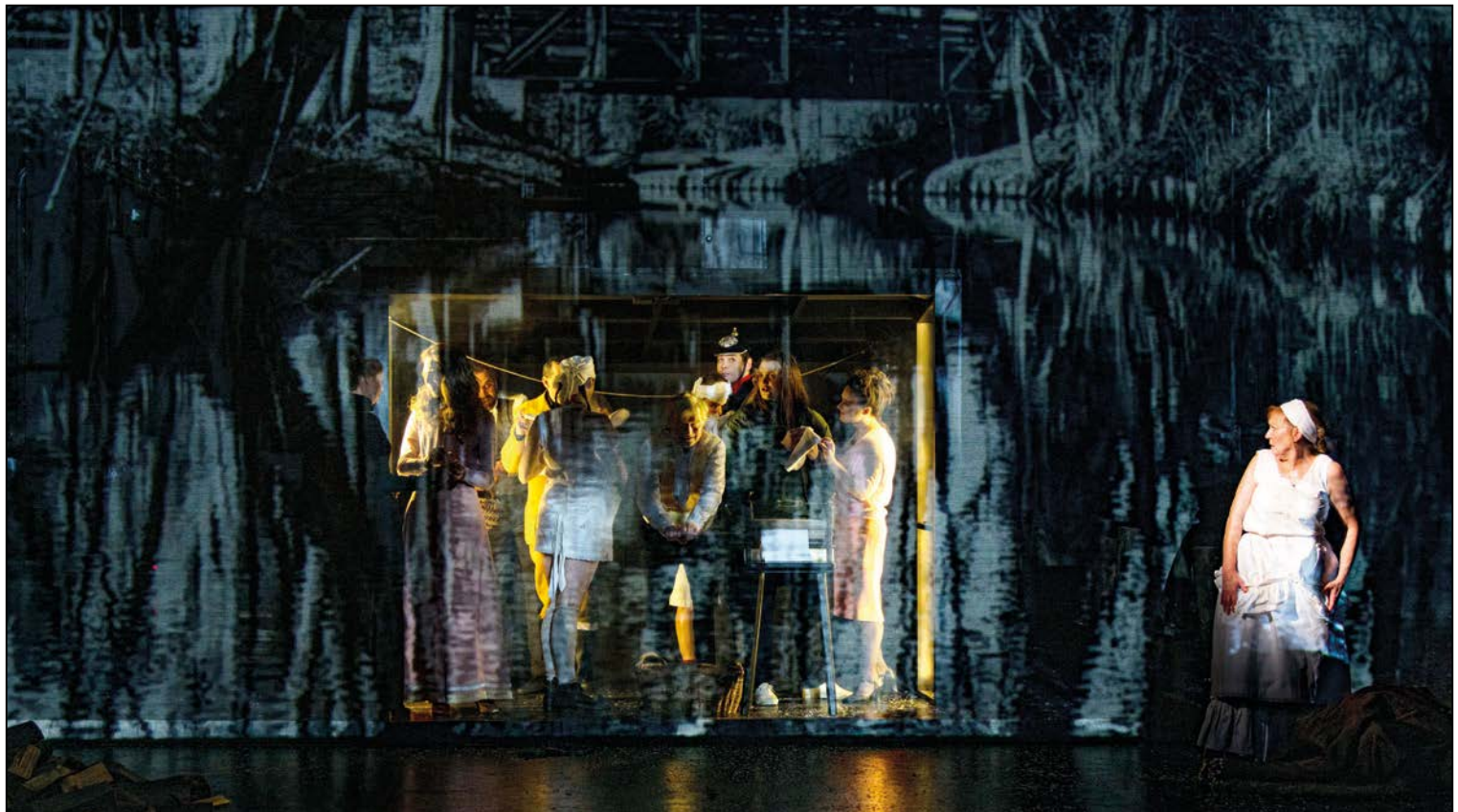
Der Biberpelz, Staatstheater Cottbus / Germany

Typical Set-Up – Front Projection. Also excellent for rear projection.